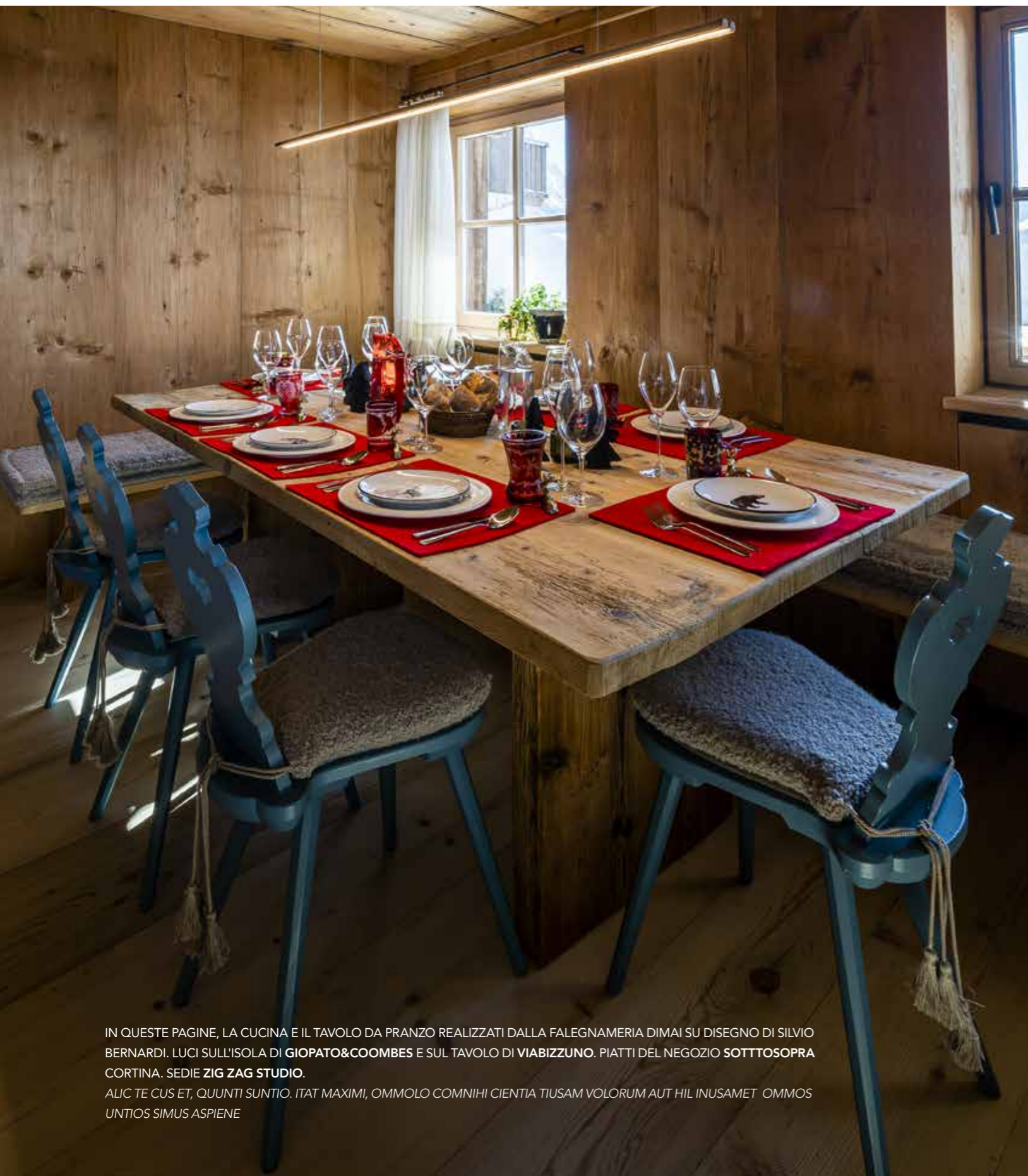
IN QUESTE PAGINE, LA CUCINA E IL TAVOLO DA PRANZO REALIZZATI DALLA FALEGNAMERIA DIMAI SU DISEGNO DI SILVIO BERNARDI. LUCI SULL'ISOLA DI GIOPATO&COOMBES E SUL TAVOLO DI VIABIZZUNO. PIATTI DEL NEGOZIO SOTTOSOPRA CORTINA. SEDIE ZIG ZAG STUDIO. ALIC TE CUS ET, QUUNTI SUNTIO. ITAT MAXIMI, OMMOLO COMNIHI CIENTIA TIUSAM VOLORUM AUT HIL INUSAMET OMMOS UNTIOS SIMUS ASPIENE