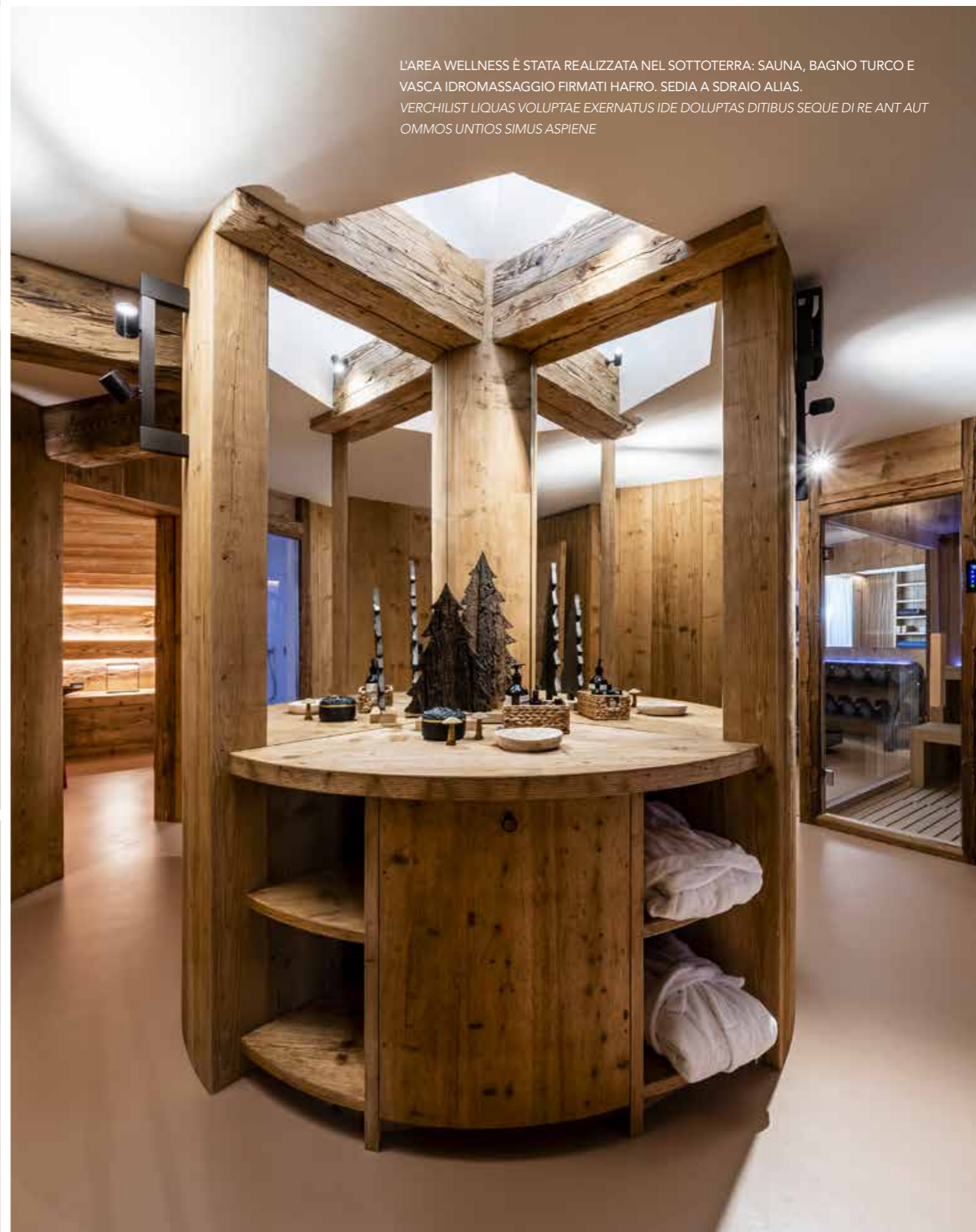
L'AREA WELLNESS È STATA REALIZZATA NEL SOTTOTERRA: SAUNA, BAGNO TURCO E VASCA IDROMASSAGGIO FIRMATI HAFRO. SEDIA A SDRAIO ALIAS. VERCHILIST LIQUAS VOLUPTAE EXERNATUS IDE DOLUPTAS DITIBUS SEQUE DI RE ANT AUT OMMOS UNTIOS SIMUS ASPIENE