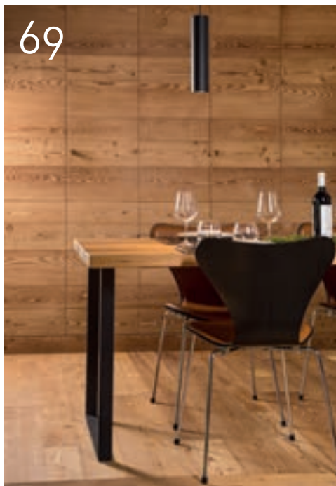
RELAX E CONVIVIALITÀ ALPINA DÉTENTE ET CONVIVIALITÉ ALPINE